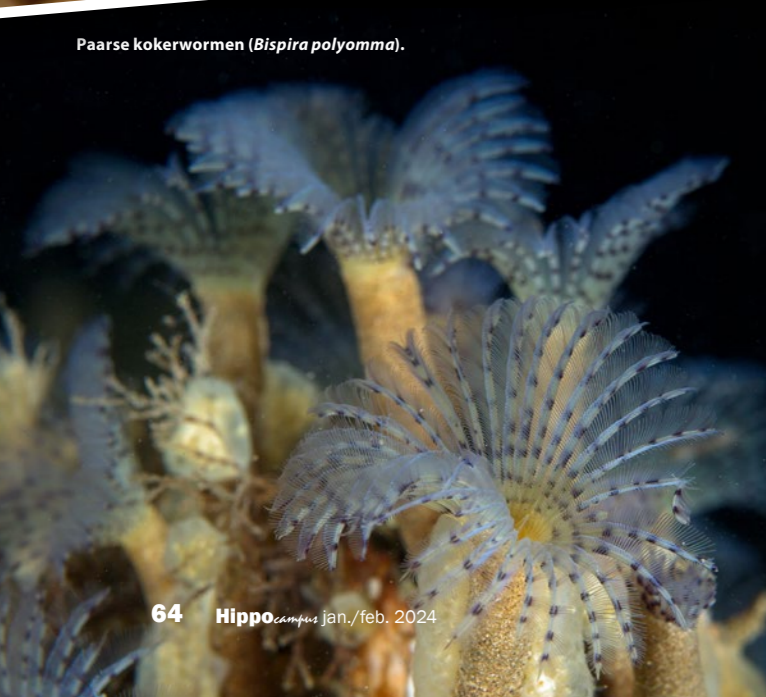
Paarse kokerwormen ( Bispira polyomma ).