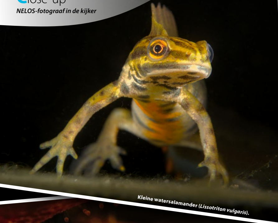
Kleine watersalamander ( Lissotriton vulgaris ).