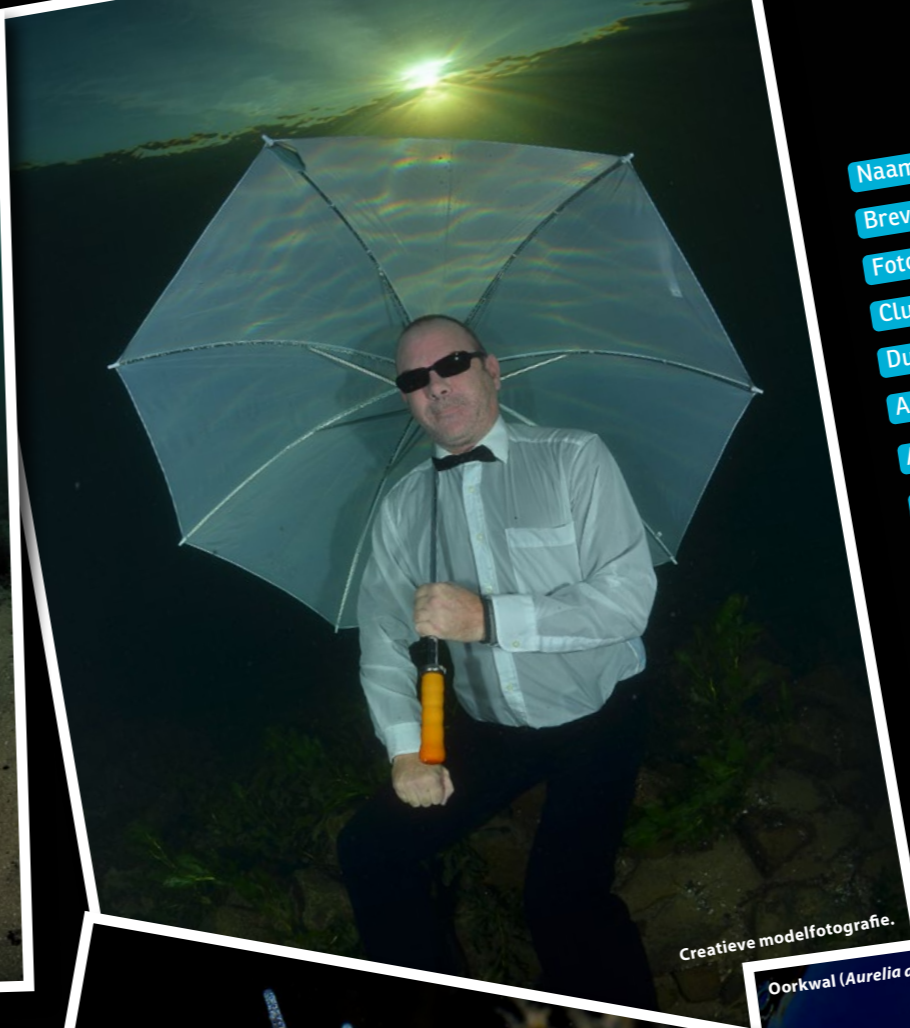
Creatieve model fotografie.