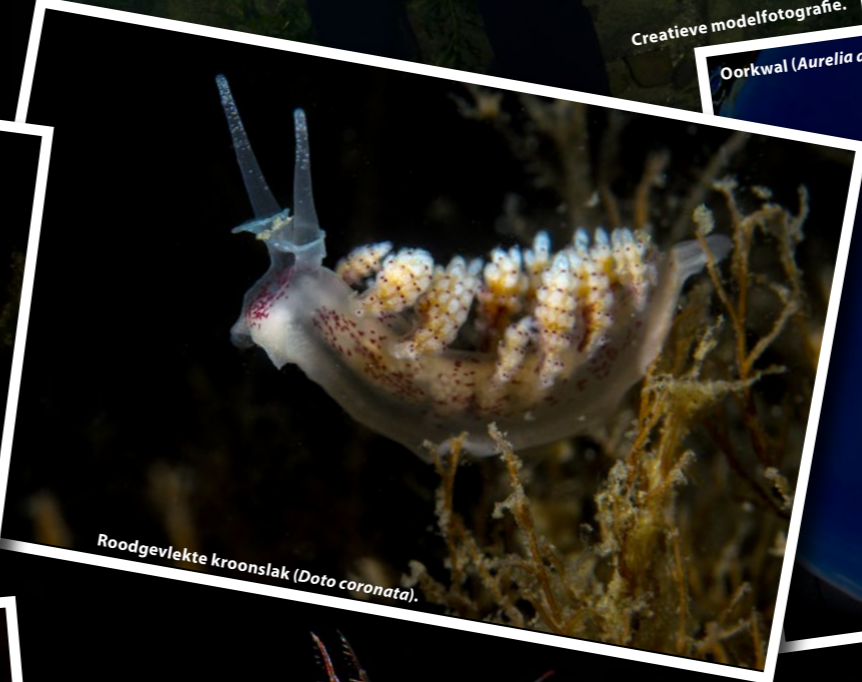
Roodgekleurde kroonslak ( Doto coronata ).