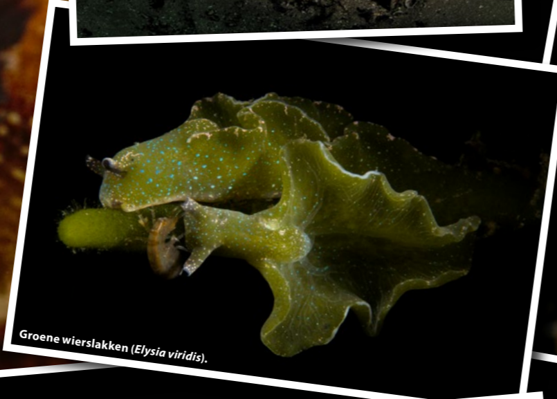
Groene wierslakken ( Elysia viridis ).