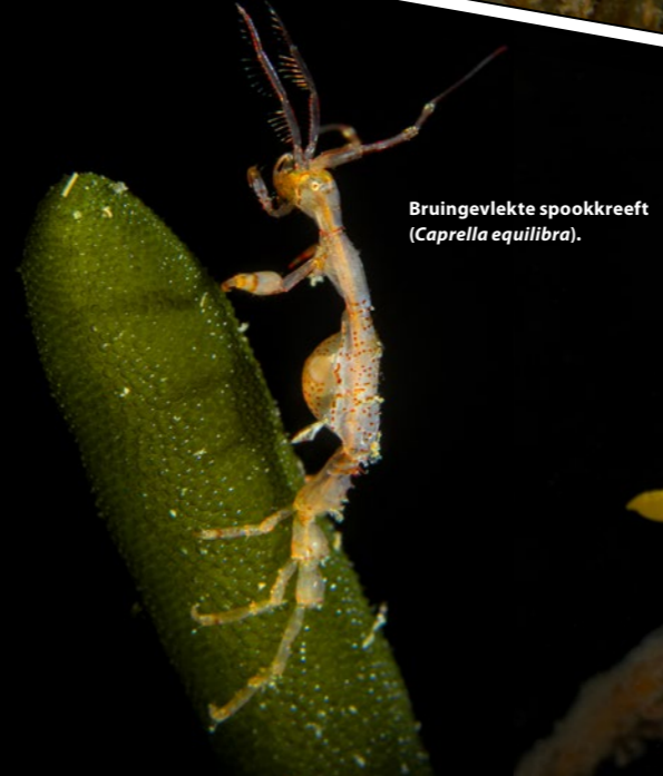
Bruingevlekte spookkreeft ( Caprella equilibra ).