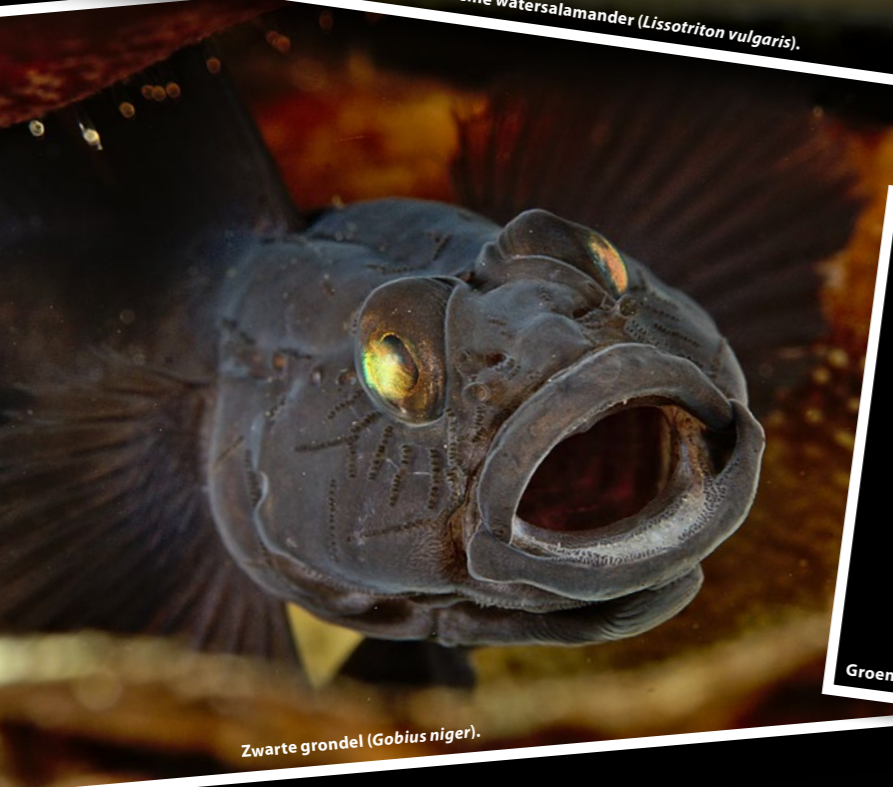
Zwarte grondel ( Gobius niger ).