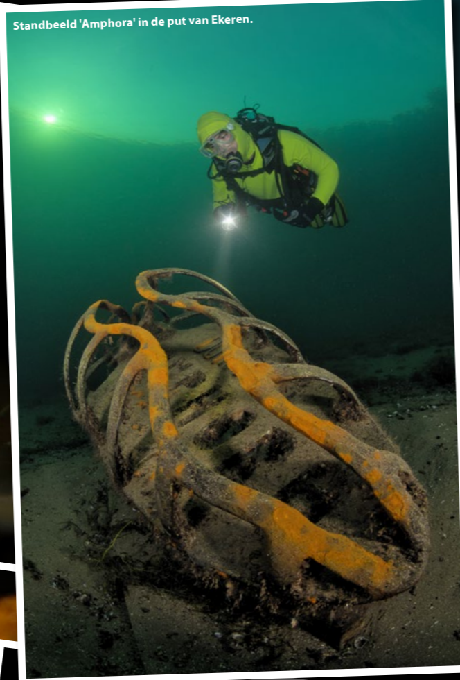
Standbeeld 'Amphora' in de put van Ekeren.