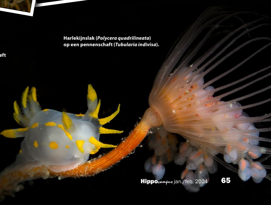
Harlekijnslak ( Polycera quadrilineata ) op een pennenschaft ( Tubularia indivisa ).