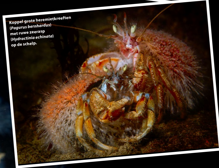
Koppel grote heremietkreeften ( Pagurus bernhardus ) met ruwe zeerasp ( Hydractinia echinata ) op de schelp.