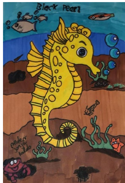
Tekening: Aeden Sercu.